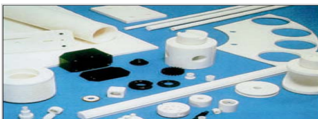
Tabella delle Stabilità materie plastiche

Ruote dentate, boccole, cambi, camme, mandrini, collettori, alimentazione pistone pompa, valvole e corpi di valvola, piste, isolatori elettrici, coclee, componenti di pompa del carburante, alimenti i connettori e rotori di sistema...etc.